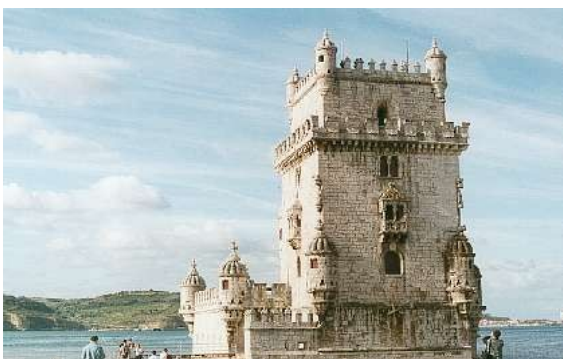
Torre de Belém

Todos os bairros merecem uma visita, tanto para os seus monumentos históricos como as suas especialidades.