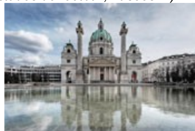
Eglise Saint-Charles Borrom