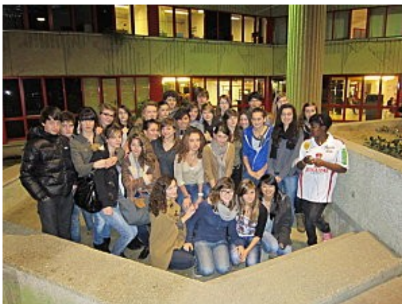
La seconde 1 du lycée de l'Iroise à Rennes